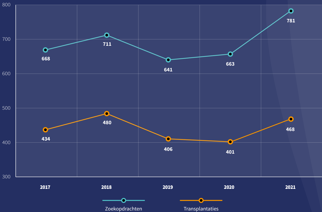
Figuur 1. Totaal aantal zoekopdrachten en transplantaties voor Nederlandse patiënten